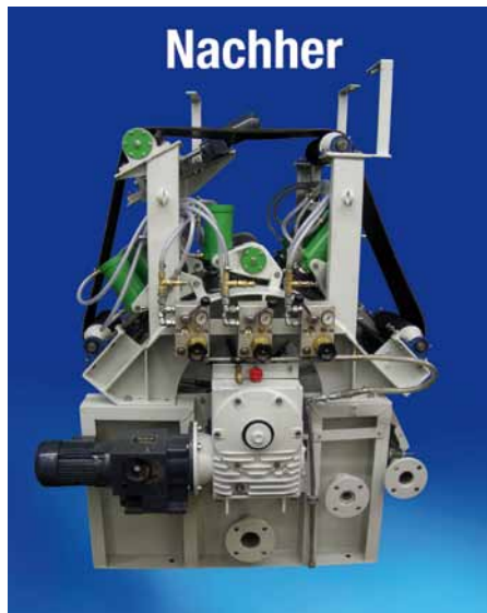
Pressbandtrommelfilter mit neuer Pneumatik und Antriebstechnik (vor und nach der Generalüberholung)