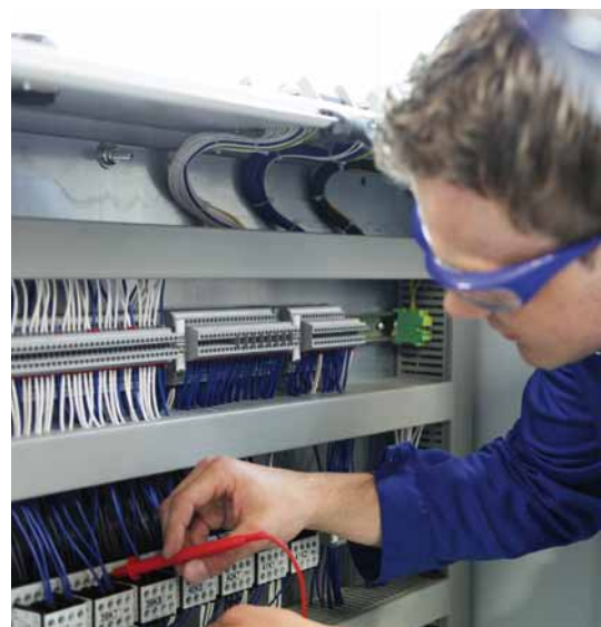
Prüfung einer Steuerungskomponente